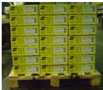
Figura 1: Empilhamento máximo de oito caixas na posição horizontal.

A ESAB recomenda o empilhamento máximo de oito caixas, uma sobre a outra. As caixas devem ser empilhadas e armazenadas na posição horizontal (figura 1). Caso seja necessário o empilhamento de paletes, deve-se usar cantoneiras (figura 2). Por questões de segurança, para paletes originais, empilhar no máximo quatro paletes quando as cantoneiras forem de madeira e no máximo dois quando as cantoneiras forem de papelão. É importante ressaltar a importância do cuidado que se deve ter ao empilhar os paletes, visto que, caso ocorra o apoio de um palete sobre outro de forma inclinada, as bobinas localizadas nas bordas podem sofrer avarias.