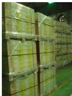
Figura 2: Paletes reforçados com cantoneiras de madeira.