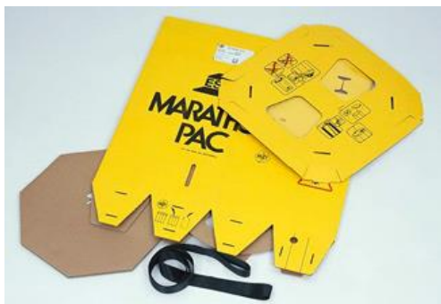
Figura 4: Marathon Pac's podem ser dobrados após o uso para minimizar o espaço de eliminação

Uma vez vazio, basta remover as cintas de elevação do tambor octogonal e dobrá-lo totalmente para facilitar e economizar espaço de armazenamento até a coleta.