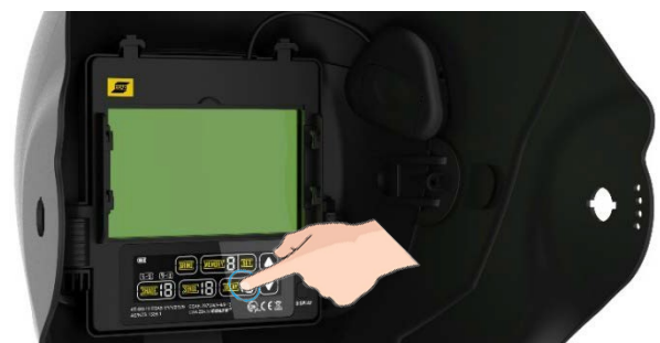
Automatischer Abdunkelungsfilter mit hoher optischer Klasse und farbigem Touchscreen