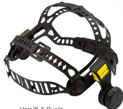
Halo™ 5-Punkt-Komfortkopfband (Vorderansicht)