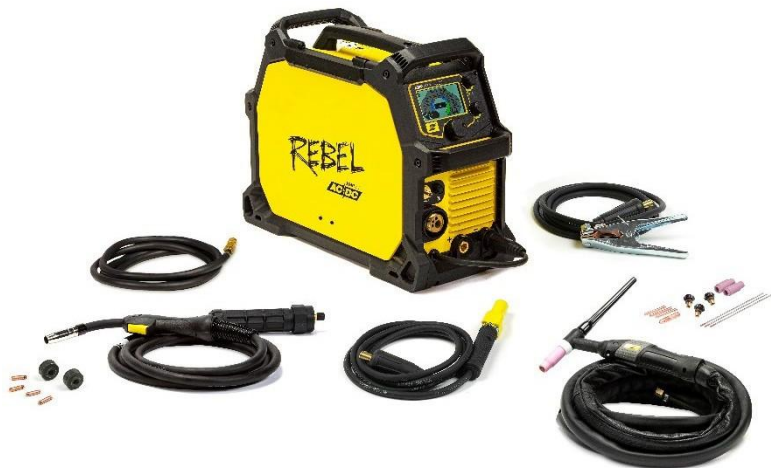
Rebel EMP 205ic AC/DC és tartozékok

Lehetővé tettük a lehetetlent a legelső hordozható, többfunkciós, MIG, portöltéses, MMA, DC TIG és most AC TIG hegesztésre képes géppel, ami azt jelenti - igen - képes az alumínium TIG hegesztésére. Ez egy VALÓDI, többfunkciós gép, amely kategóriája legjobb teljesítményét kínálja minden eljárásnál a piacon napjainkban elérhető leghordozhatóbb, legtartósabb, bárhová elvihető, bármit meghegesztő ipari csomagban.